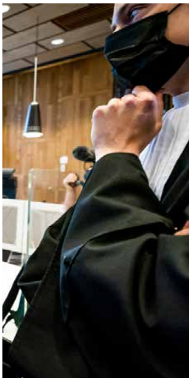
Remko de Waal / ANP