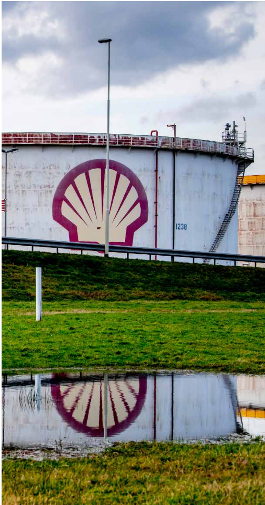
Shell in Pernis. 4 februari

Na de Urgenda-zaak, die van het klimaat een mensenrechtenissue maakte, verplichtte de Nederlandse rechter ook Shell om de bevolking te beschermen tegen mogelijke rampen. Dat Shell zijn biesen pakte en naar Engeland vertrok, laat onverlet dat morele gedragscodes ook voor multinationals steeds dwingender worden.